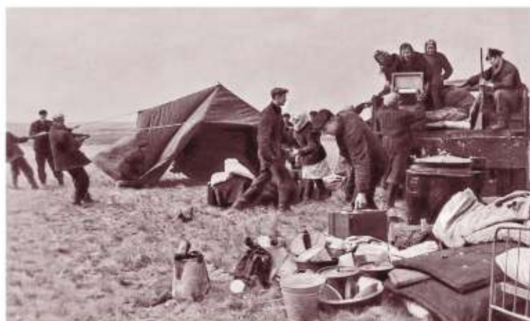
Первые целинники. 1954 г.

► Реформы в области экономики. Развитие народного хозяйства. Реформы, проводившиеся Н.С.Хрущевым, носили противоречивый характер. В свое время Сталин наметил экономические рубежи, на которые страна должна была выйти в ближайшее время. Теперь СССР вышел на эти