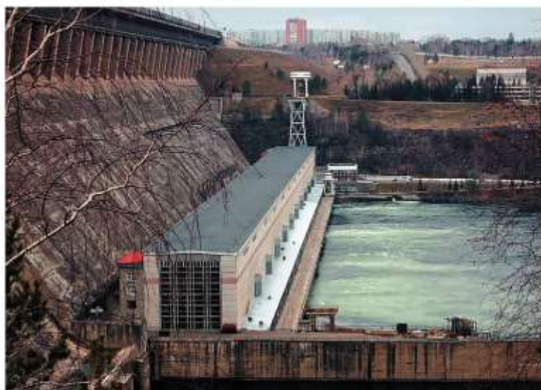
Братская ГЭС и вид на город Братск

серьезные трудности в экономике наглядно продемонстрировали утопичность идей Хрущева. Эти трудности во многом были связаны с непродуманными реорганизациями последних лет его правления. Так, были ликвидированы центральные министерства, их функции перешли в руки совнархозов , созданных в разных регионах страны. Это нововведение, имевшее и ряд положительных последствий, вело к разрыву связей между регионами, тормозило внедрение новых технологий.